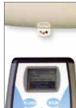
příklad nastavení parametrů

Podrobný popis zařízení viz. průvodní dokumentace. Technické změny vyhrazeny. Zvláštní příslušenství není součástí dodávky.